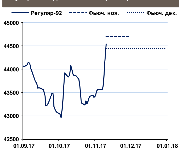
Регуляр-92: индекс Москва и фьючерсы ₽/т